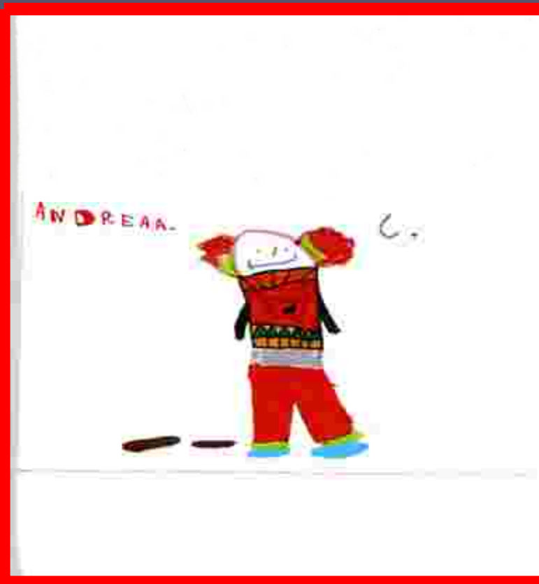
Illustrazione di Andrea A. Storia inventata da Amal e Leonardo

C'era una volta un clown che era triste mentre camminava trovò delle scarpe che erano diverse dalle sue: erano tutte marroni, mentre le sue erano azzurre. Pensò che qualcuno le aveva lasciate là, così fa finta di niente e va via da un suo amico. Entra in una panetteria e compra del pane, torna a casa mangia cena con un panino ed è felice