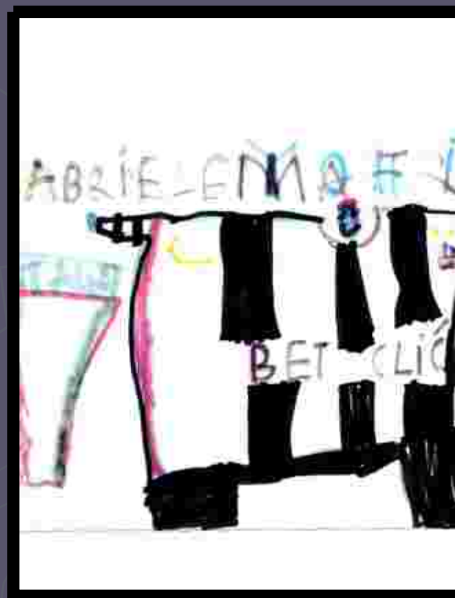
Illustrazione di Gabriele Storia di Riccardo e Pietro

Poi Crasic si riprende il pallone e fa gol, ma il portiere si arrabbia perché tutti gli fanno gol.