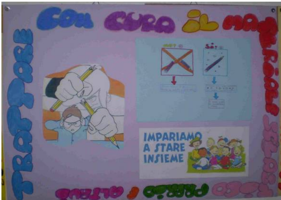
'TRATTARE CON CURA IL MATERIALE SCOLASTICO PROPRIO E ALTRUI'