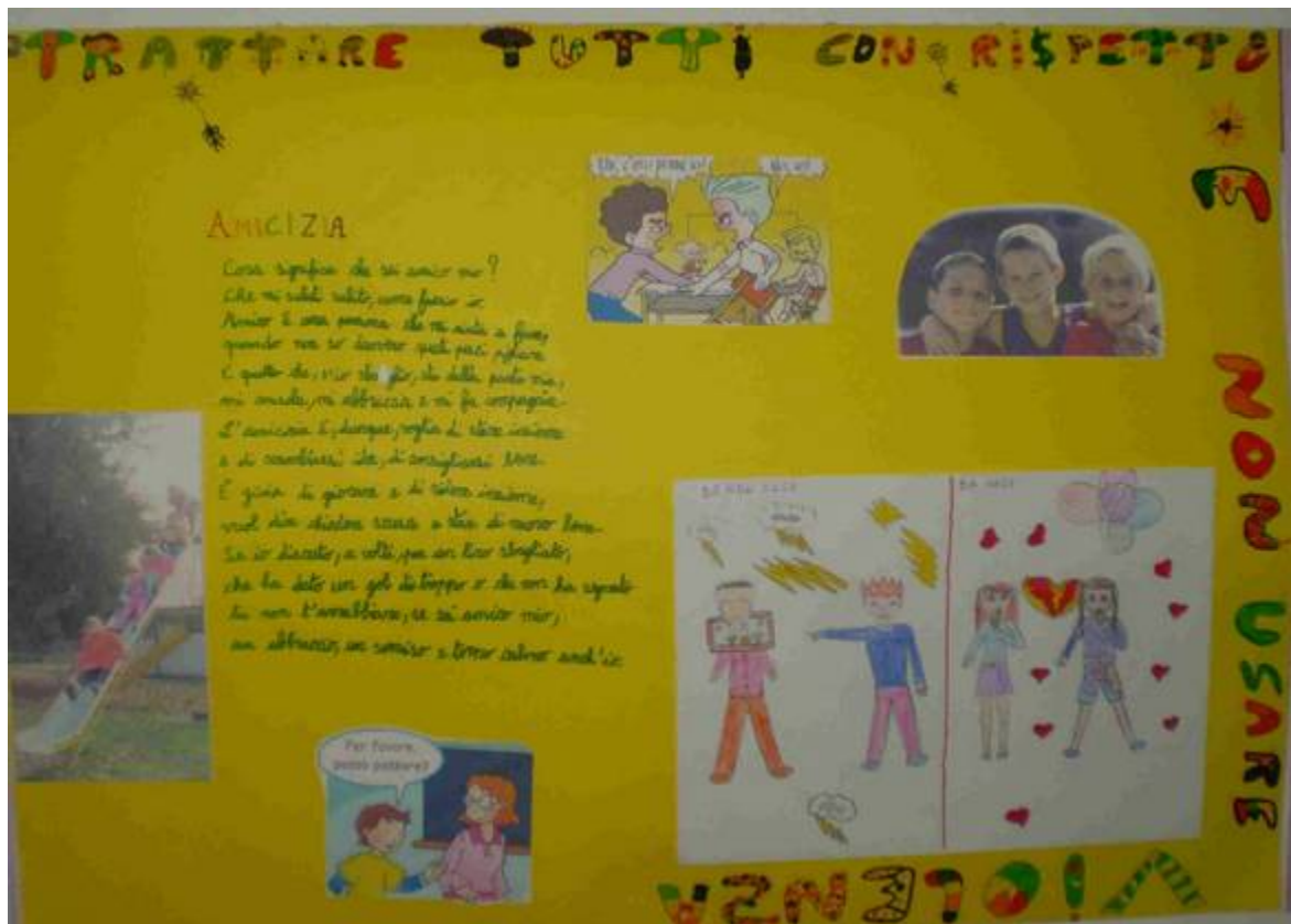
'TRATTARE TUTTI CON RISPETTO E NON USARE VIOLENZA'