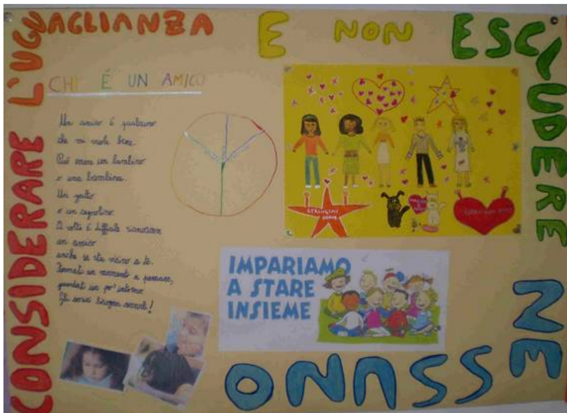
'CONSIDERARE L'UGUAGLIANZA E NON ESCLUDERE NESSUNO'