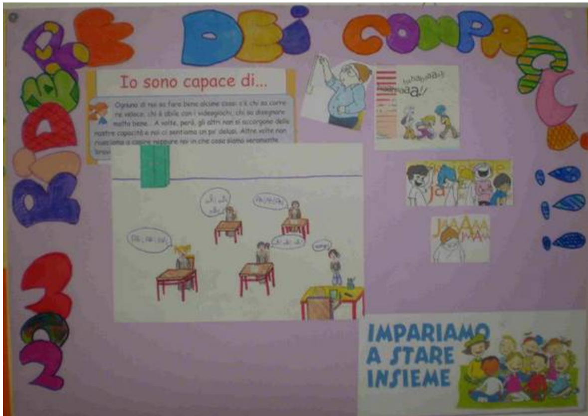
'NON RIDERE DEI COMPAGNI'